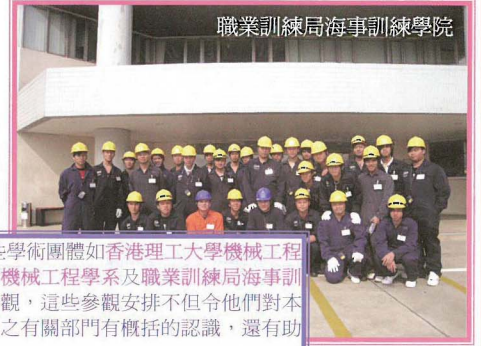
職業訓練局海事訓練學院

自 2009 年 3 月至 2009 年底，一些學術團體如香港理工大學機械工程學系、香港專業教育學院青衣分校機械工程學系及職業訓練局海事訓練學院之同學們均曾蒞臨本公司參觀，這些參觀安排不但令他們對本公司之船舶修理部和打撈及拖船部之有關部門有概括的認識，還有助他們將來在此行業的就業發展。