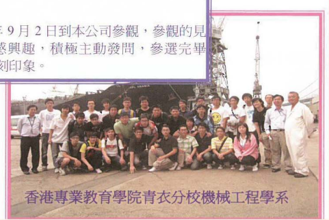
香港專業教育學院青衣分校機械工程學系

此外，太古集團見習生亦於 2009 年 9 月 2 日到本公司參觀，參觀的見習生們均對部門之日常工序非常感興趣，積極主動發問，參選完畢後，各見習生們都對船塢留下了深刻印象。