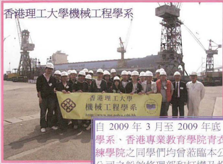
香港理工大學機械工程學系